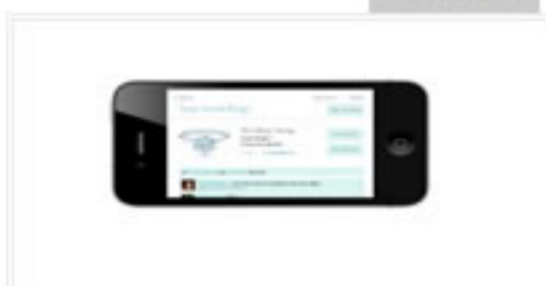
訂婚?又怎能沒有為訂婚戒指而設的IPHONE APP?