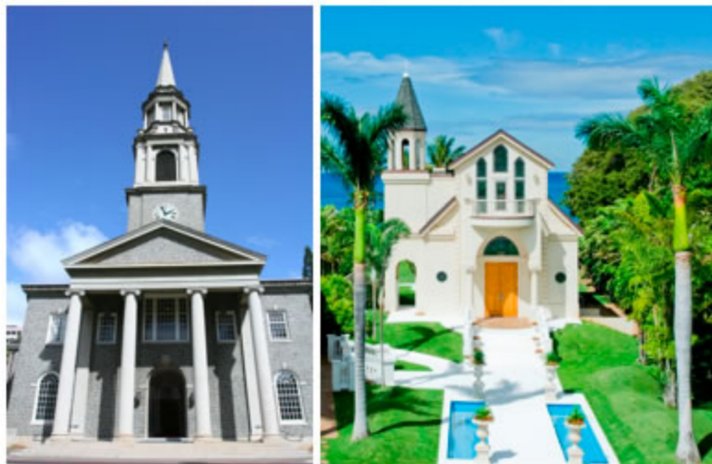
擁有瑰麗建築的「CUC 大教堂」 如童話城堡般的「水晶教堂」