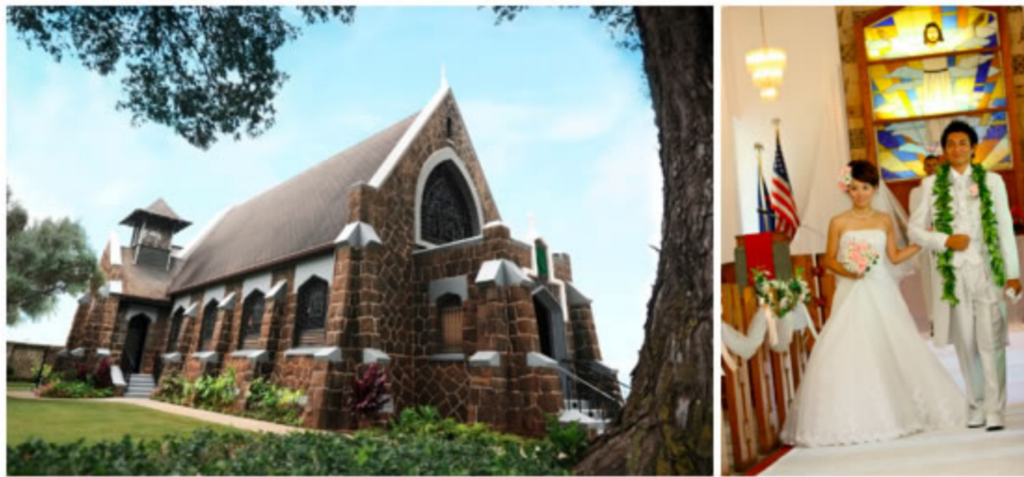
精緻浪漫童話式的「特色教堂」