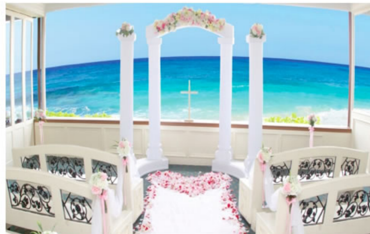
被白沙灘環抱的「海之教會」

夏威夷位於美國太平洋中心，擁有四周環海的漂亮沙灘，她的陽光與海灘更是世界聞名的，每月平均約有300對新人於美麗島上舉行婚禮。