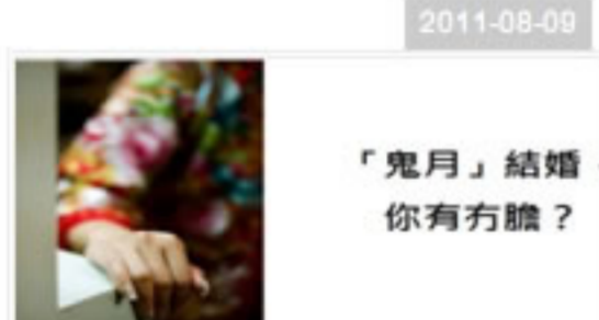
「鬼月」結婚，你有冇膽?