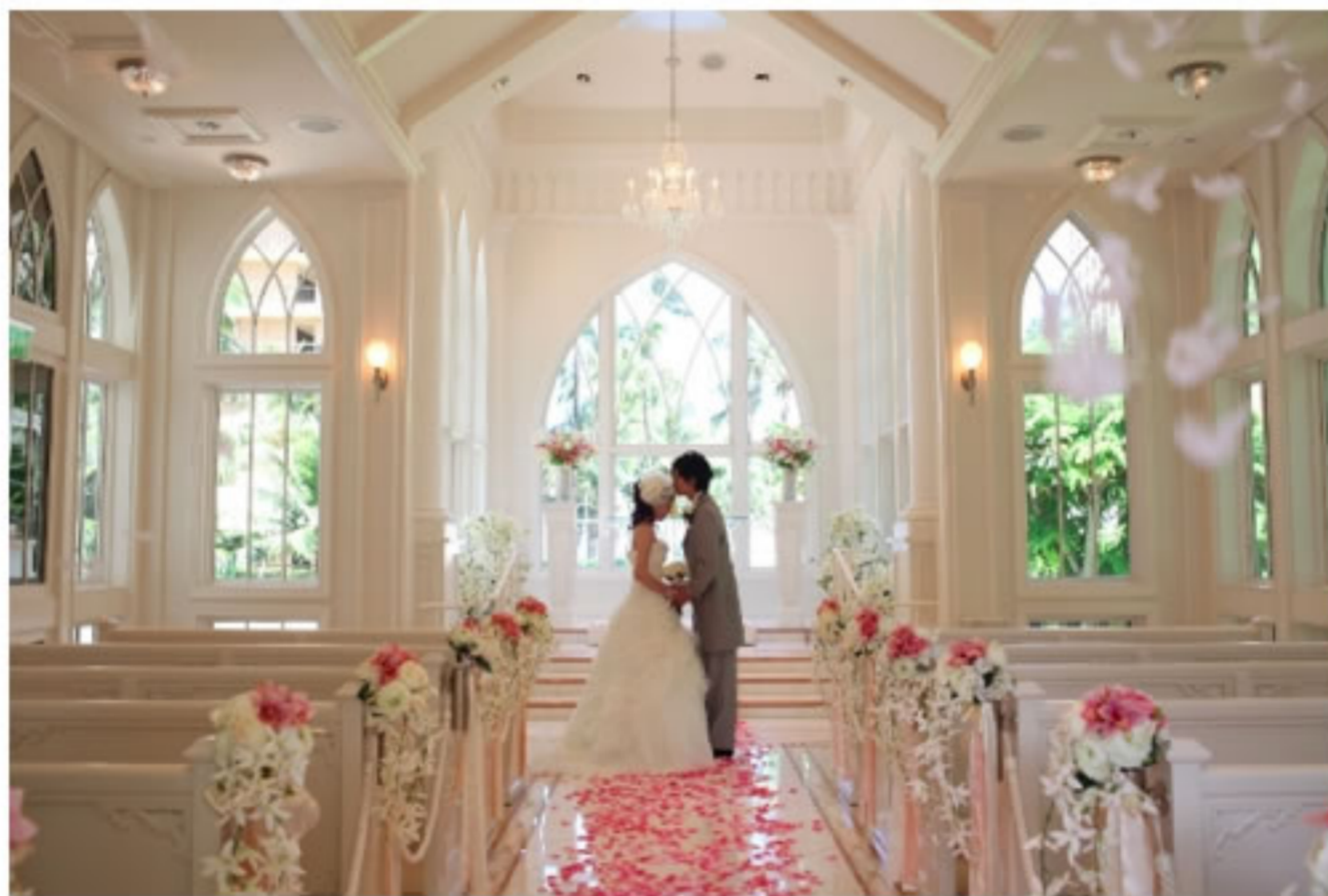
置身美麗綠洲的「海洋教堂」