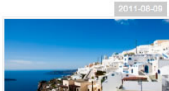
七大「愛之城」，你去過幾個?